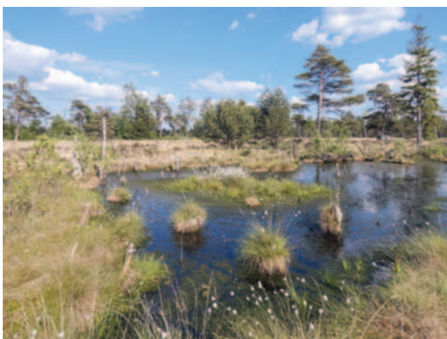
Abb. 4.61-3: Libellula quadrimaculata besiedelt ein breites Spektrum an Stillgewässern. Hochstet und oft auch in großen Abundanz werden Moorgewässer besiedelt, wie dieser wiedervernässte Torfstich im Großen Moor bei Wistedt. Landkreis Harburg, 18.05.2019.

Die Hauptflugzeit dauert ca. zehn Wochen von Mitte Mai bis Anfang August. 50 % der Beobachtungen von Imagines erfolgten bis zum 10. Juni, 75 % bis zum 3. Juli und 90 % bis zum 22. Juli. Bis Ende August wurden noch regelmäßig Imagines beobachtet, Sichtungen im September sind