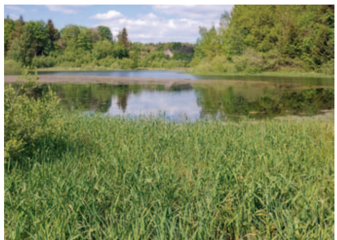
Abb. 4.61-4: Auch mesotrope Gewässer werden von Libellula quadrimaculata oft zahlreich besiedelt. Ein Beispiel hierfür ist der historische Mittlere Pfaunteich im Oberharz, dessen Wasserstände schwanken. Im sich aus Phalaris arundinacea und Carex vesicaria zusammensetzenden Röhricht der Wechselwasserzone im Vordergrund wurden am Aufnahmetag 70 Exuvien auf einer Fläche von rund 5 m 2 gefunden. Landkreis Goslar, 28.05.2020.