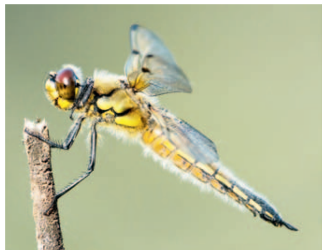
Abb. 4.61-2: Libellula quadrimaculata (Weibchen). Region Hannover, 02.06.2019.