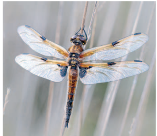
Abb. 4.61-1: Libellula quadrimaculata (Männchen). Landkreis Friesland, 23.05.2015.

Die Verbreitung und Häufigkeit von L. quadrimaculata hat sich in den letzten Jahrzehnten nicht entscheidend verändert. Der Anteil der Meldungen dieser Art ist seit 1985 landesweit nahezu konstant geblieben, und auch der sich auf den Zeitraum vor/seit 2010 beziehende Bestandsentwicklungsfaktor (BEF) zeigt mit einem Wert von 1,0 einen gleichbleibenden Trend. Bei den einzelnen Naturräumlichen Regionen zeigt sich lediglich in den Börden mittel- und auch kurzfristig ein schwach negativer Trend (BEF 0,7). Es ist anzunehmen, dass dies mit einem Rückgang der